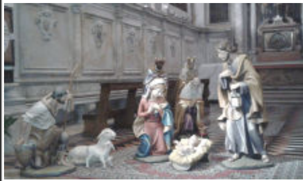
Il nostro Presepio in Cattedrale nella Cappella dei santi martiri Felice e Fortunato

SS. Messe: ore 10.15 con un Battesimo; ore 12 - 17